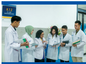
Hall Fakultas Kedokteran