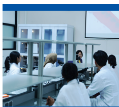
Lab. Patologi Anatomi