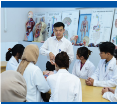
Lab. Anatomi Kering