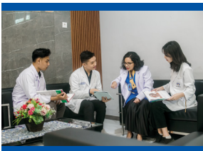
Lobi Fakultas Kedokteran