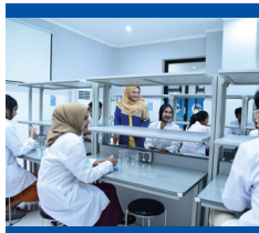
Lab. Patologi Klinik