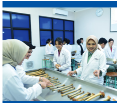
Lab. Anatomi Basah