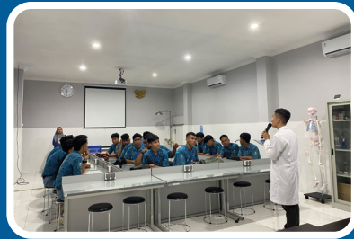
Kunjungan ke FK Udinus